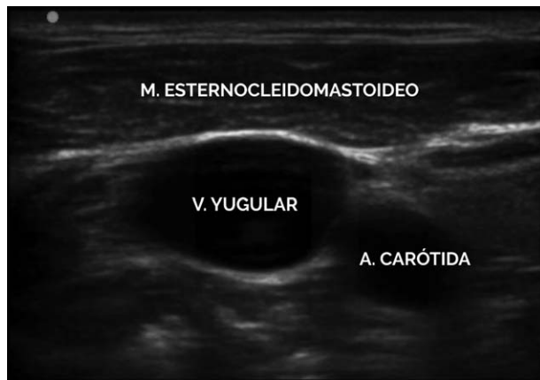
Figura 2. Ventana ecográfica donde se observa relación de la vena yugular y estructuras vecinas.

movimiento de la sonda izquierda o derecha mientras se observa la imagen, debe ayudar a confirmar la orientación adecuada. 15