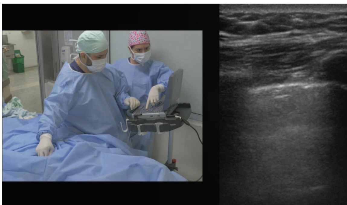
Figura 4. Barrido ecográfico de pleura y pulmón.

realizado por el British National Institute for Clinical Excellence (NICE), 29 encontró una disminución del riesgo relativo de complicaciones, intentos fallidos y fracaso al primer intento en 57%, 86% y 41%, respectivamente; así entonces, con el uso del ultrasonido para un catéter venoso central en vena yugular interna son menores los riesgos de punción arterial inadvertida y hematoma local, entre otros.