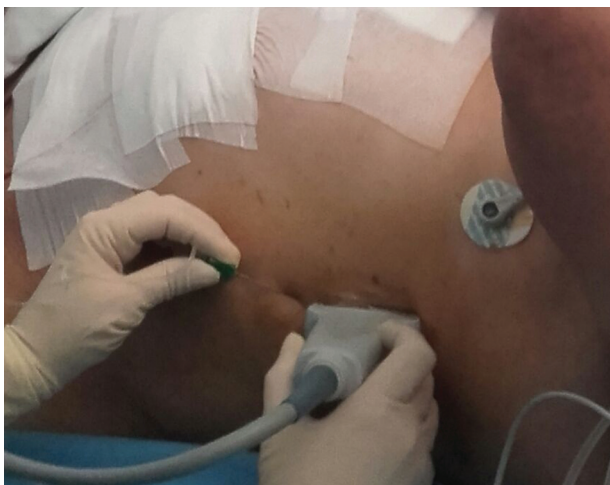
Figura 1. Posición del paciente, sonda y plano de entrada.

Todos los pacientes descritos firmaron el consentimiento informado previo a la realización de la técnica anestésico-analgésica objeto de la serie de casos (BRILMA modificado). Este bloqueo fascial se realiza bajo visión ecográfica (equipo portátil M-Turbo, Sonosite®, Bothell, WA, USA), utilizando una sonda lineal de alta frecuencia 6–15 Hz y aguja 80 mm Ultrplex 360 (B. Braun®, Germany). Con el paciente en decúbito supino, se coloca la sonda en el plano sagital de la línea media axilar (Fig. 1) para